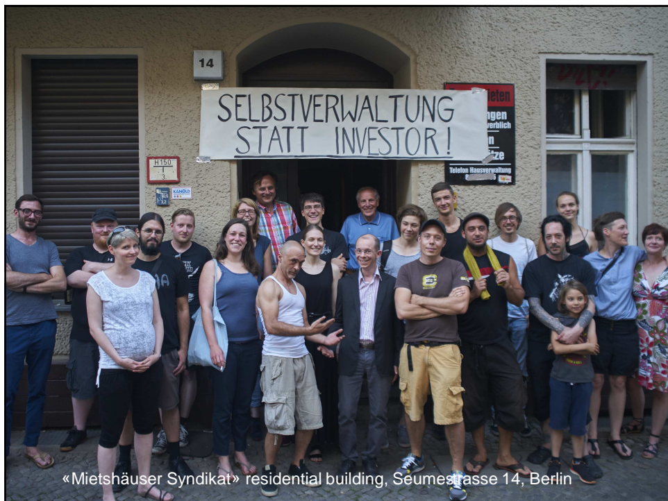
«Mietshäuser Syndikat» residential building, Seumesstrasse 14, Berlin