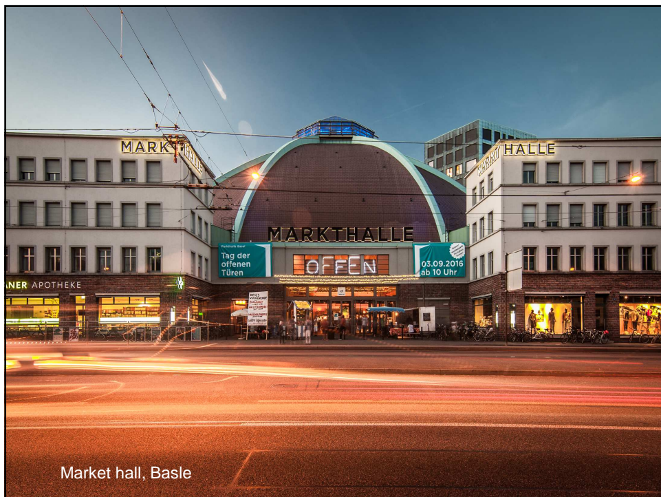
Market hall, Basle