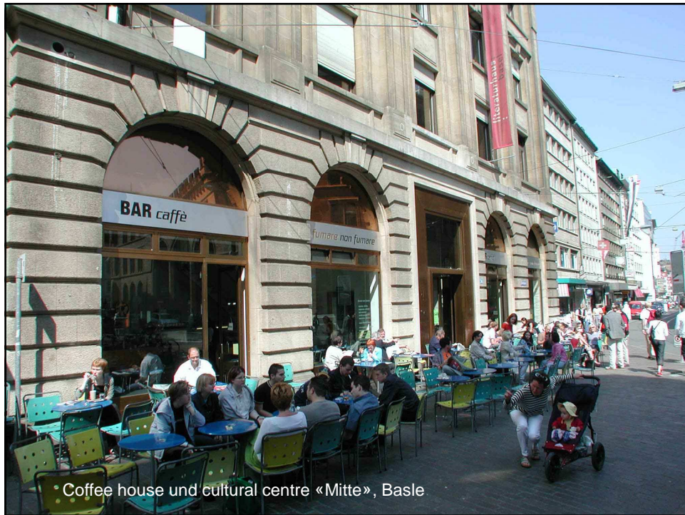
• Coffee house und cultural centre «Mitte», Basle